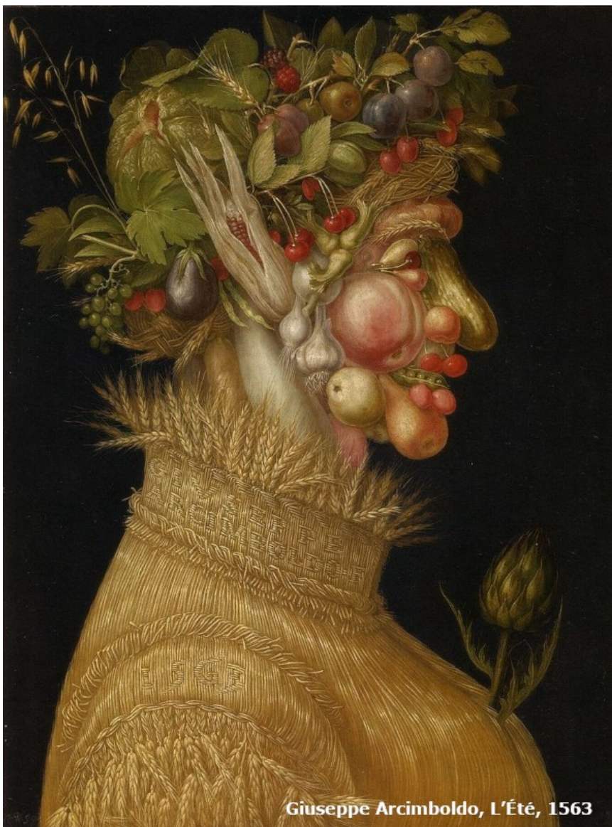
Giuseppe Arcimboldo, L'Été, 1563

En été, la production agricole génère la majorité des végétaux de consommation :