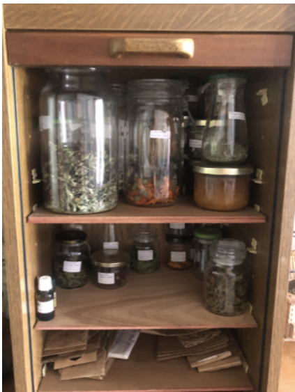
← Stockage dans le « secrétaire » avec porte coulissante

Pour ceux qui seraient intéressés, je propose une visite de mon jardin le samedi 13 septembre à 14h . (Détails et coordonnées seront annoncées sur le site des Jardiniers en Pays d'Auge ( www.jardiniersenpaysdauge.fr ) et par mail à tous les adhérents. Ce sera l'occasion d'échanger autour des plantes aromatiques et médicinales et de vous montrer mon séchoir (places limitées et uniquement sur inscription).