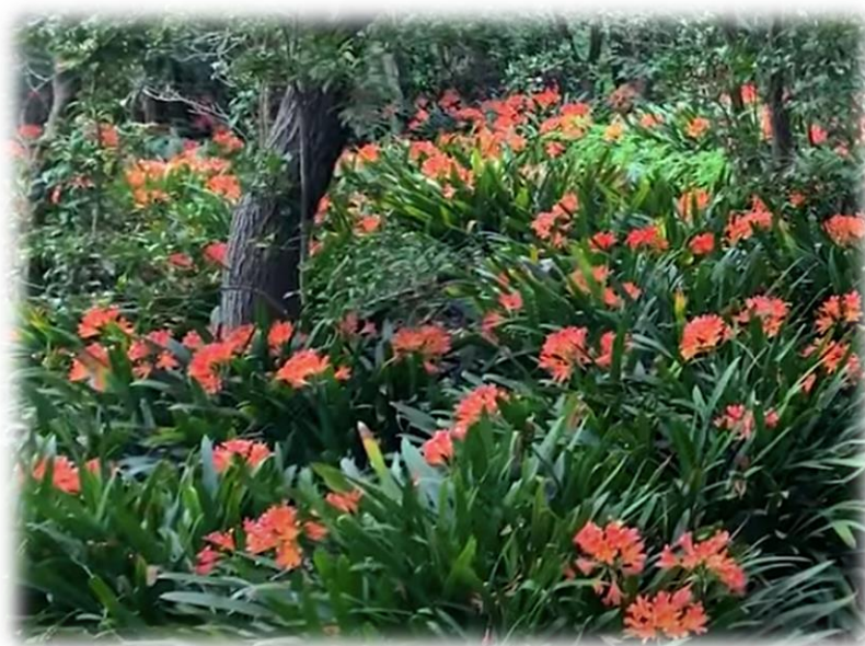
Clivias dans un jardin botanique à Los Angeles

Il en existe plusieurs variétés. (A voir en jardinerie, fleuristes...)